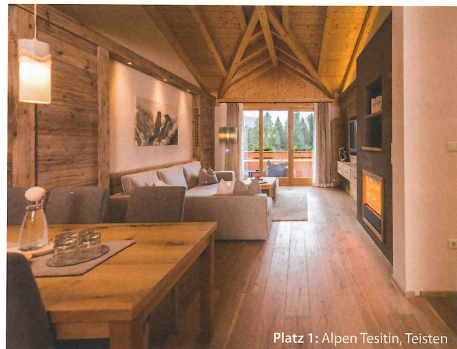
Platz 1: Alpen Tesitin, Taisten