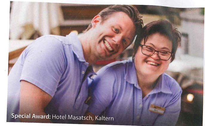
Special Award: Hotel Masatsch, Kaltern

sicherte sich das Hotel Quellenhof der Familie Dorfer in St. Martin in Passeier, gefolgt vom Hotel Gerstl in Mals, Hotel Post Alpina in Innichen und Hotel Schwarzenstein in Luttach, die es gemeinsam auf den dritten Platz schafften. Mit dem „Special Award“ wurde das barrierefreie Hotel Masatsch in Kaltern ausgezeichnet, das sich durch das Konzept, Gästen mit besonderen Bedürfnissen entgegenzukommen, heraushob.